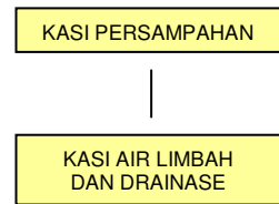
Gambar 1 Bagan Struktur Organisasi Dinas Cipta Karya, Permukiman dan Perumahan Kab. Kotabaru