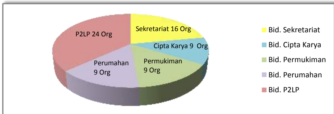
Gambar 2 Jumlah Pegawai Dinas Cipta Karya, Permukiman dan Perumahan dalam Angka

Jumlah Pegawai pada Dinas Cipta Karya, Permukiman dan Perumahan Kabupaten Kotabaru pada Tahun 2016 dikelompokkan menurut jabatan struktural, tingkat pendidikan, pangkat/golongan, dan jenis kelamin adalah sebagai berikut :